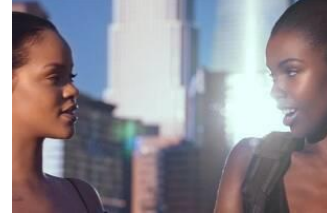
FENTY BEAUTY BY RIHANNA