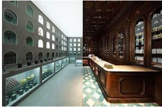
OFFICINE UNIVERSELLE BULY