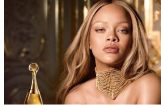
PARFUMS CHRISTIAN DIOR