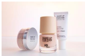
MAKE UP FOREVER