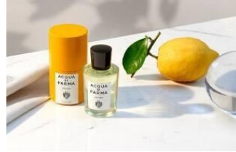
AQUA DI PARMA